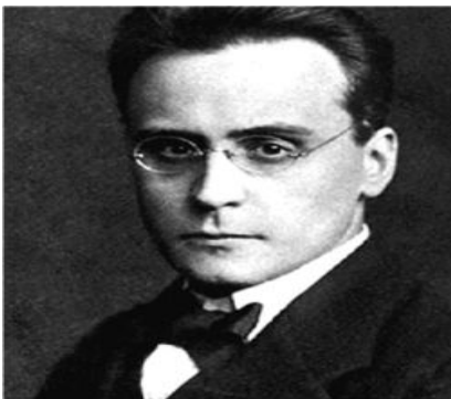
Anton Webern (1883-1945)

Kompositionsprincippet i tolvtonemusik kan være, at man laver en bestemt rækkefølge af de 12 toner, og så kan man spille rækkefølgen forfra, bagfra (krebsgang), spejlvendt (omvending) og spejlvendt bagfra efter tur eller på samme tid. Altså til en vis grad en matematisk måde at lave musik på. Det er materialets indbygget struktur, det abstrakte system, der er det sande i musikken. Tolvtonemusikken kan være meget voldsom og disharmonisk, hvorfor den også kaldes ekspressionisme (= udtryk). De førende tolvtonekomponister, Schönberg, Alban Berg og Anton Webern, flygtede til USA under nazismen, fordi deres musik blev opfattet som »entartet« udartet, degenereret.