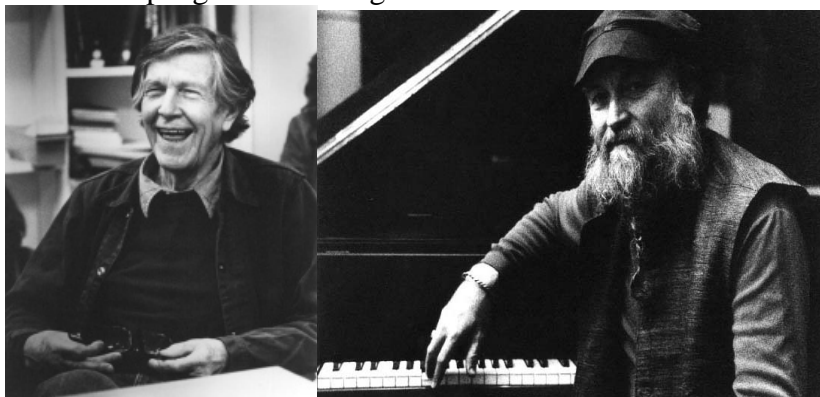
John Cage (1912-1992) Terry Riley (1935-)

han på et album med bandet The Planets som en hæder til Cage havde lavet en sang, »A one minute silence«, som bestod af et minuts stilhed. Batt hævdede i retsagen, at stilheden på hans sang var en anden stilhed end i Cages komposition. Sagen endte med forlig, hvor Batt betalte penge til John Cage-fonden.