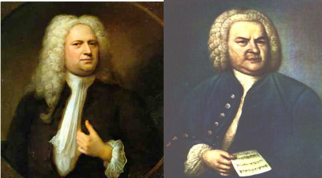
Georg Friedrich Händel (1685-1759), tysk/engelsk barokkomponist –Johan Sebastian(1685-1750) Bach, tysk barokkomponist