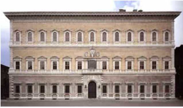
Eksempel på italiensk verdslig, renæssancearkitektur Palazzo Farnese i Rom