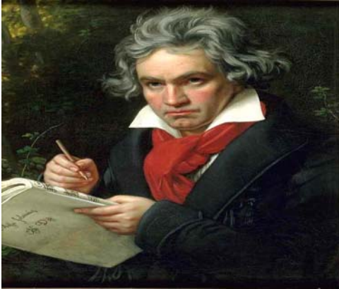
Ludvig van Beethoven (1770-1827)