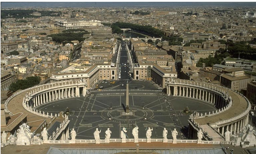
Peterspladsen i Rom som udtryk for streng symmetri