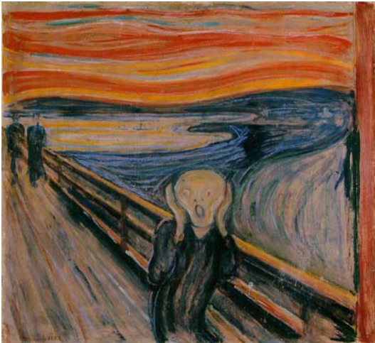
Edvard Munch: Skriget, 1893

Når det ydre bliver farvet af det indre bliver det besjælet og forvrænget. Blandt udtryksmidlerne i billedkunsten er brug af farver og farvesymbolik.