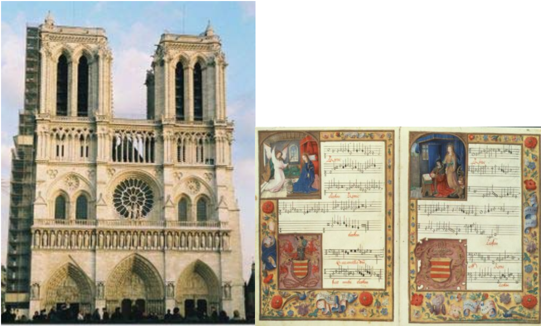
Notre Dame kirken i Paris + håndskrevne noder fra middelalderen