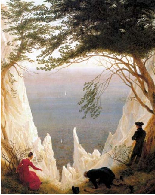
Caspar D. Friedrich (1774-1840..den dragende, voldsomme og mystiske natur