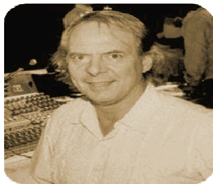
Karl Heinz Stockhausen (1928-)