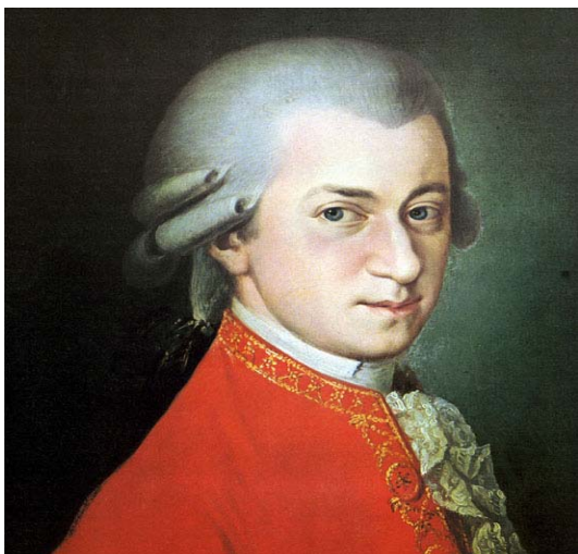
Wolfgang Amadeus Mozart (1756-91)